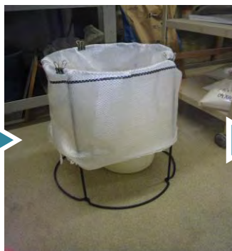
② ろ過の方法(参考例) 【土嚢袋 + フラワースタンド】