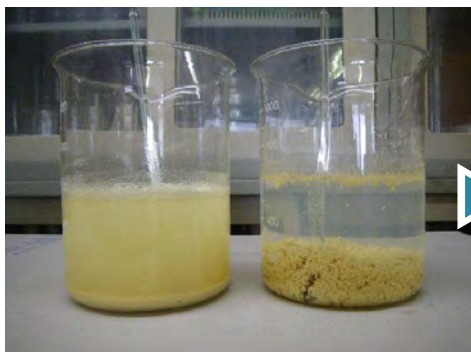
① パテ洗浄水10Lに対してNSクリーン小袋(50g)1袋を添加。1~2分間攪拌した後、約5分間静置する。